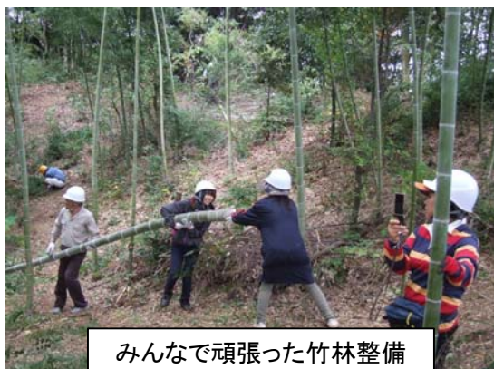
みんなで頑張った竹林整備