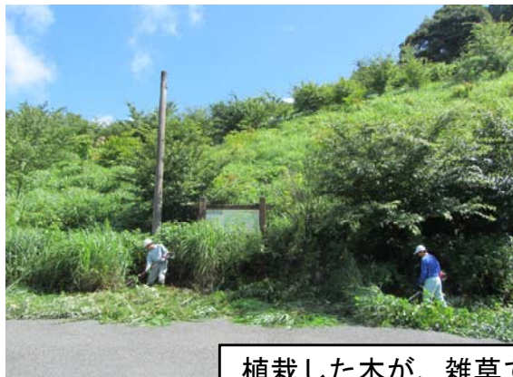
植栽した木が、雑草で見えなくなっています