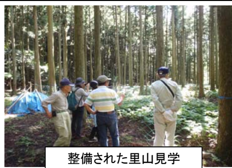
整備された里山見学