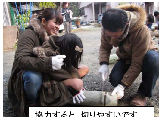
協力すると、切りやすいです