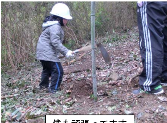
僕も頑張ってます