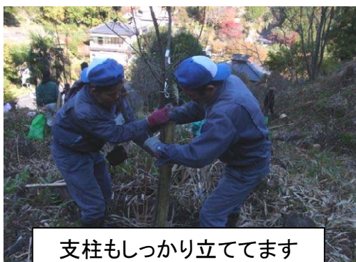
支柱もしっかり立ててます