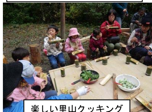
楽しい里山クッキング