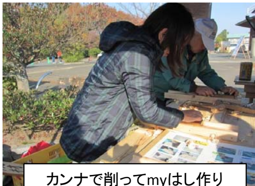
カンナで削ってmyはし作り