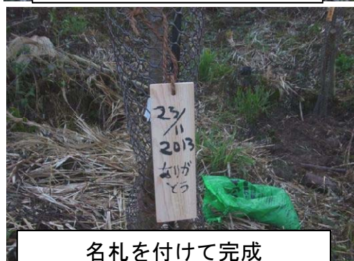
名札を付けて完成