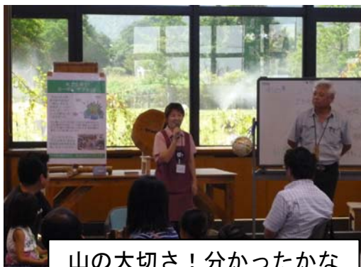
山の大切さ！分かったかな