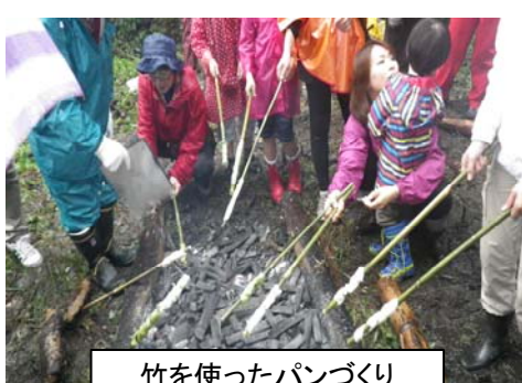
竹を使ったパンづくり