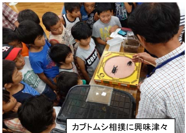
カブトムシ相撲に興味津々