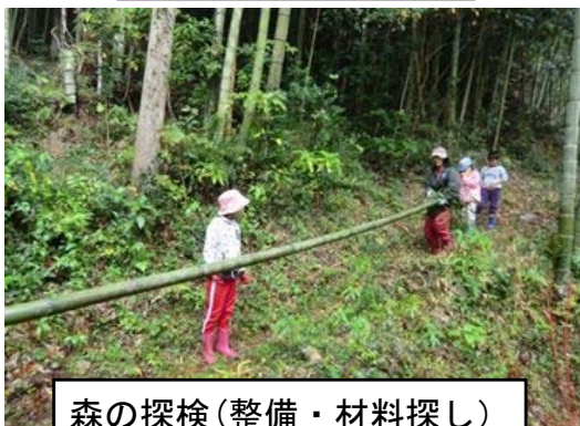
森の探検(整備・材料探し)