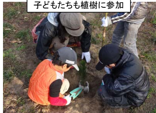
子どもたちも植樹に参加