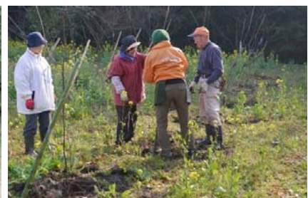
緑を増やす植樹・下刈、枝打ち活動 (森林体験)