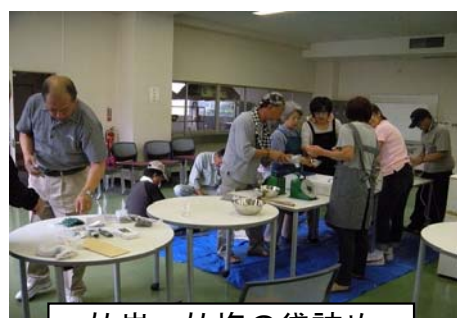
竹炭、竹塩の袋詰め