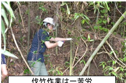
伐竹作業は一苦労