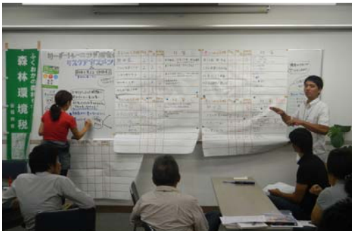
活発な意見交換が行われました