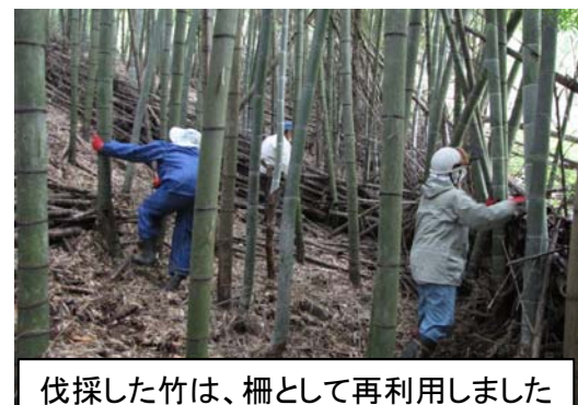
伐採した竹は、柵として再利用しました