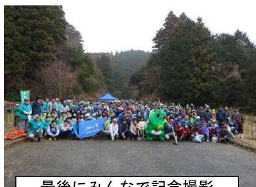
最後にみんなで記念撮影