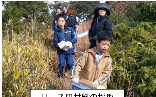
リース用材料の採取