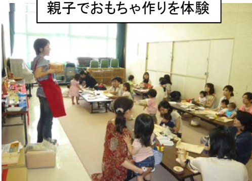
親子でおもちゃ作りを体験