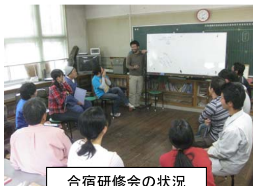
合宿研修会の状況