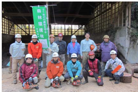
覚えた技術は今後の森林づくりに活かします！