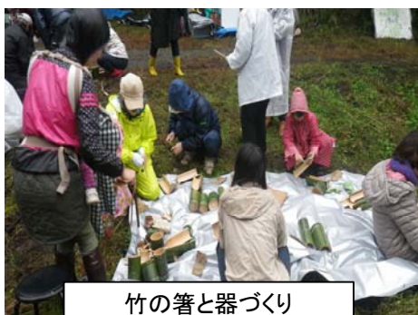
竹の箸と器づくり