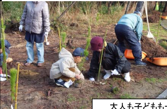
大人も子どもも一緒に植樹しました