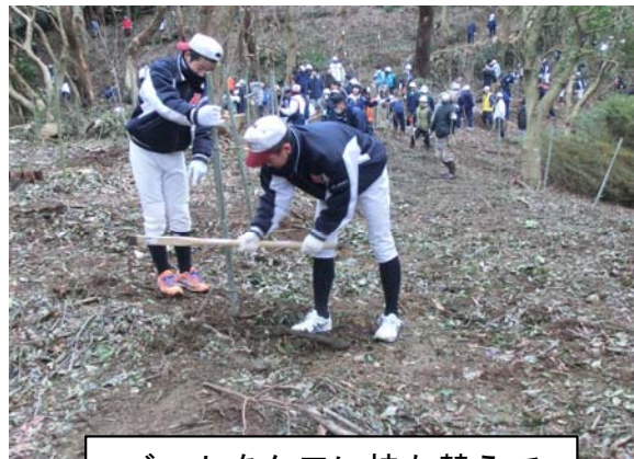
バットをクワに持ち替えて