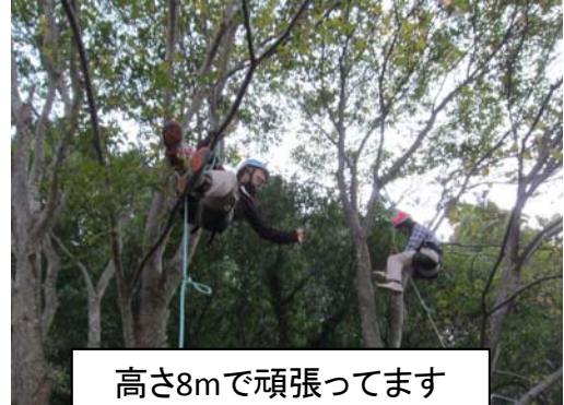
高さ8mで頑張ってます