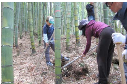
コツを教えてもらいながらタケノコ掘り