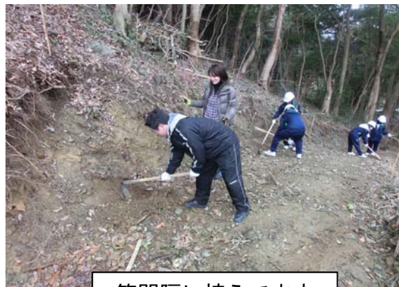
等間隔に植えてます