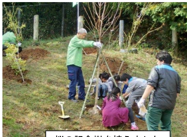
桜の記念樹を植えました