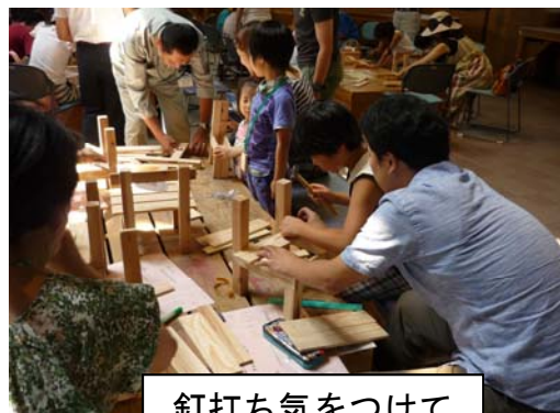
釘打ち気をつけて