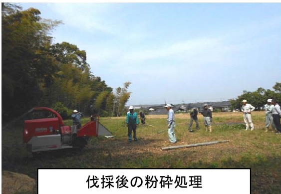
伐採後の粉碎処理