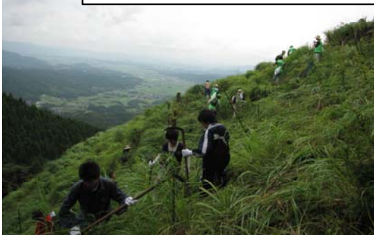
下草刈りに、汗をながしました