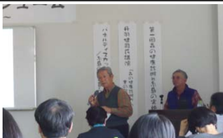
森の健康診断実施報告