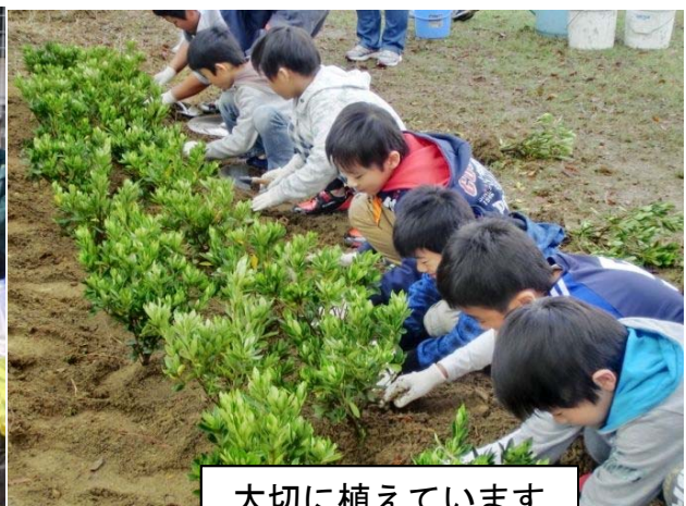
大切に植えています