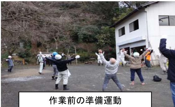
作業前の準備運動