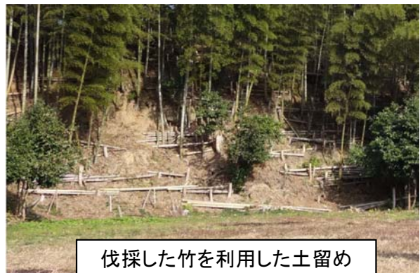
伐採した竹を利用した土留め