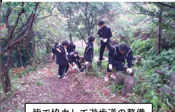
皆で協力して遊歩道の整備