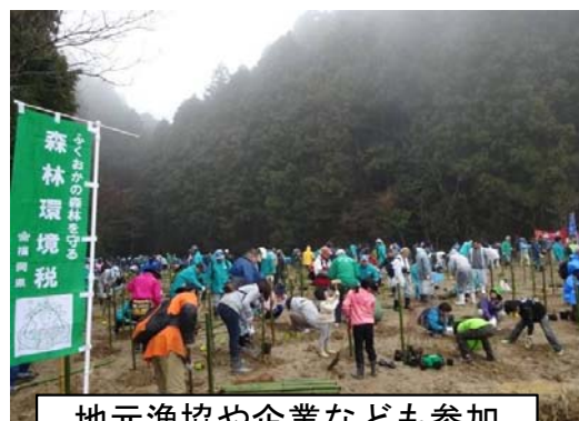
地元漁協や企業なども参加