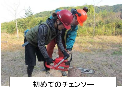
初めてのチェーンソー