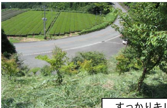
すっかりキレイになりました