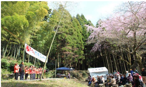
竹林コンサート：中国雲南省の楽器フルスの演奏