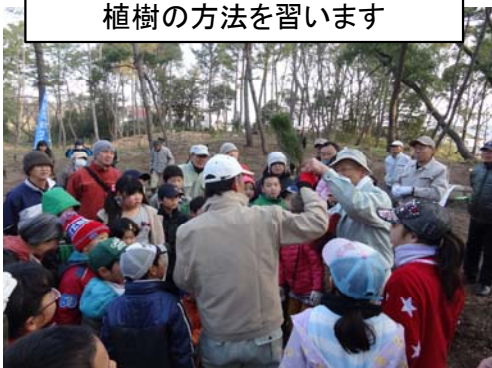
植樹の方法を習います