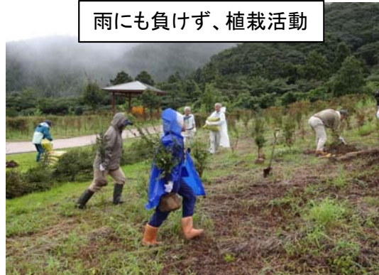
雨にも負けず、植栽活動