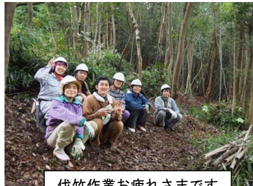
伐竹作業お疲れさまです