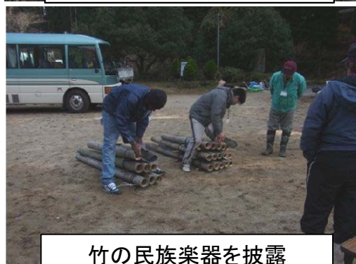
竹の民族楽器を披露