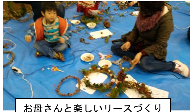
お母さんと楽しいリースづくり