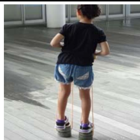
竹ポックリ上手に乗れるかな？