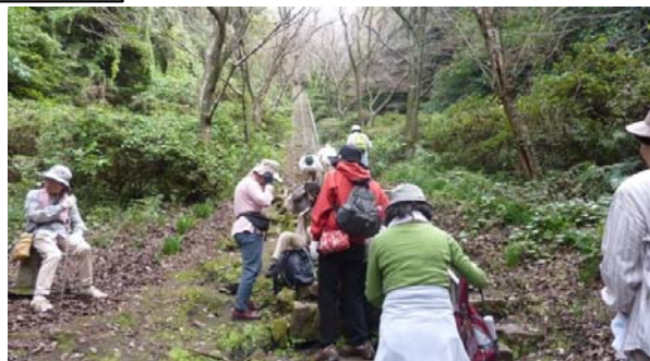
みんなで歩こう花立山(自然観察)