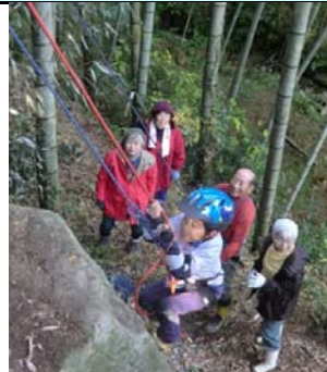
果敢にクライミングに挑戦！