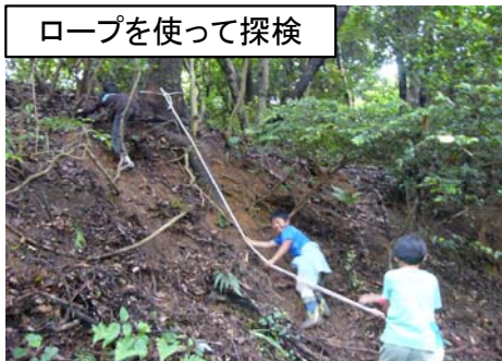
ロープを使って探検