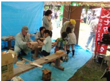
野鳥は入ってくれるかな (巣箱づくり)