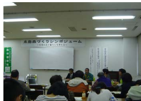
シンポジウムの状況