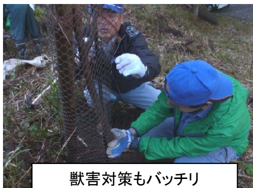
獣害対策もバッチリ