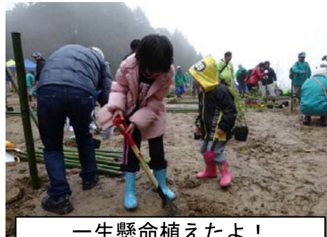
一生懸命植えたよ！