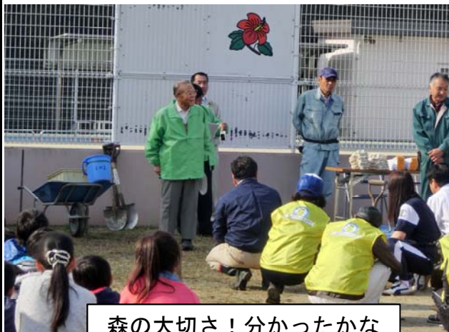
森の大切さ！分かったかな