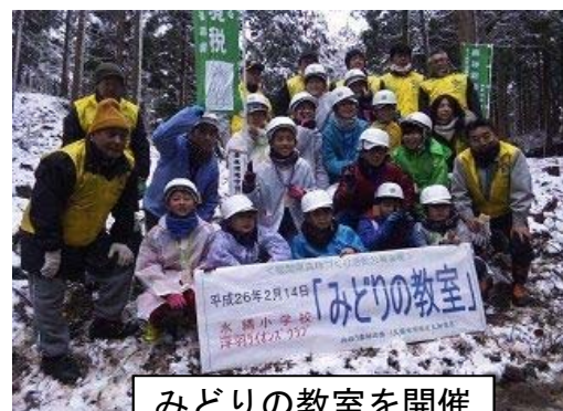
みどりの教室を開催