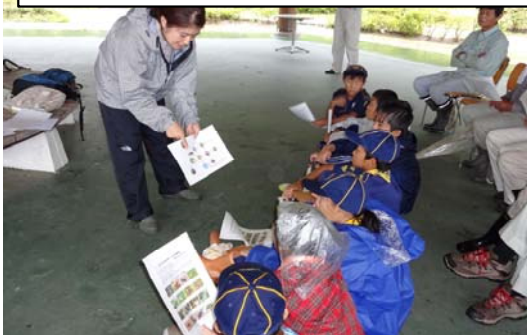
那珂川町の自然・生き物について学習