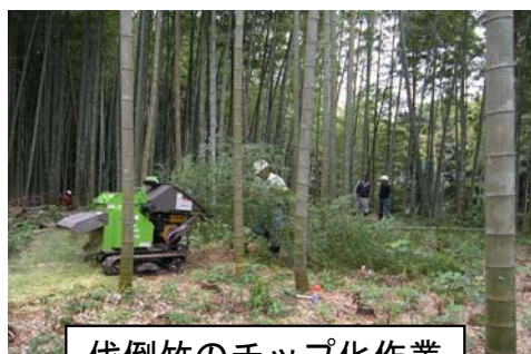
伐倒竹のチップ化作業