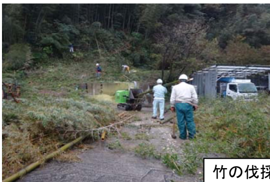
竹の伐採搬出状況