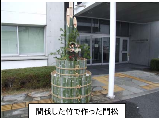
間伐した竹で作った門松