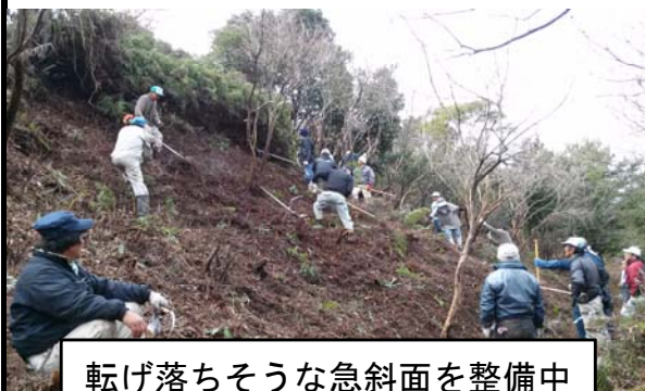
転げ落ちそうな急斜面を整備中