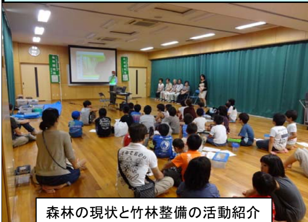
森林の現状と竹林整備の活動紹介