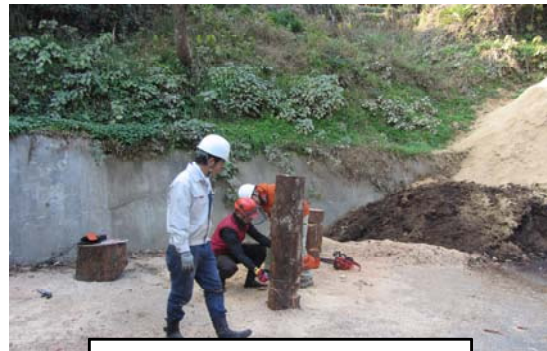
安全に木を伐る実習