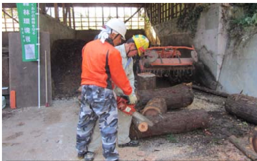
基本のチェーンソーワークから