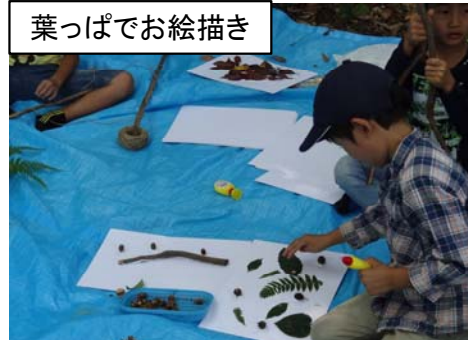
葉っぱでお絵描き